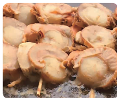
北海道産ホタテ串 2本 500円