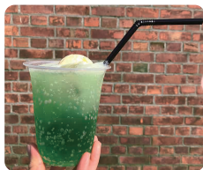
クリームソーダ 300円