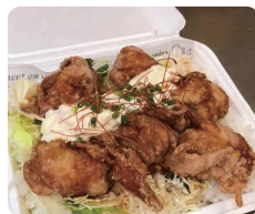
アニキのザンタレ丼 M 500円 L 800円