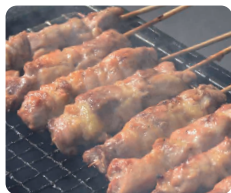
炭火焼き鳥 2本 300円