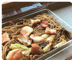
ホルモン焼きそば 600円