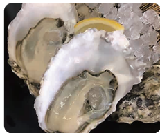
厚岸産特大牡蠣 2個 700円