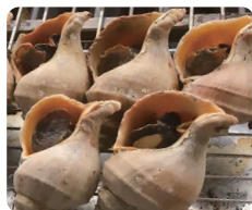
厚岸産焼つぶ 3玉 600円