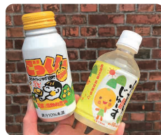
ごっくん馬路村 130円 小夏じゅーす 140円他