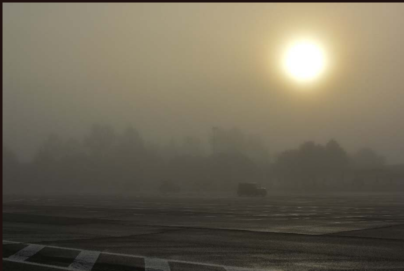
道央道/樽前SA/10月撮影